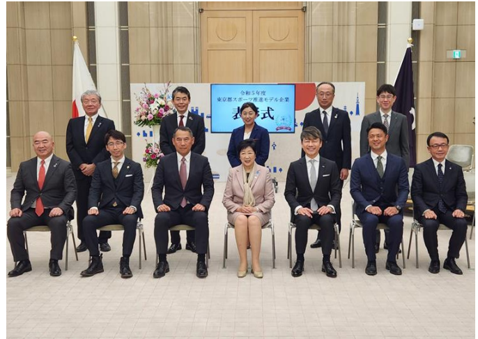
令和5年度 モデル企業との写真撮影